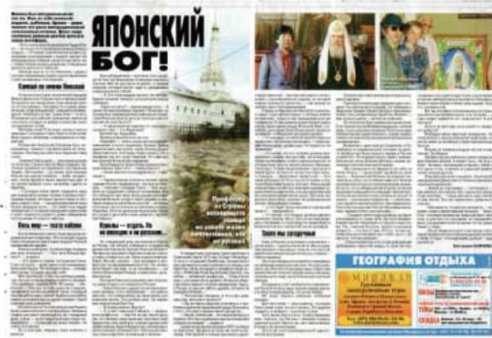
(写真1)2013年8月24日の朝刊「モスコフスキー・コムサモレーツ」

・ロシアからお帰りなさい。対談が一回お休みになったので、あおほの読者は随分と待ちわびていました。そこで、今回はロング対談にしました。と言うのも、前回はものすごい反響で、特に秋田の若い女性たちがここ最近になって北方四島のことについて関心を持つようになってきているので、丁度グッドタイミングの記事でした。